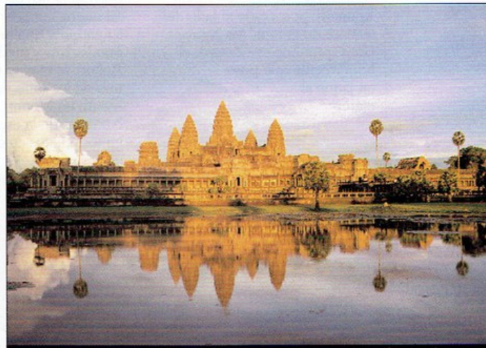
Imagen del templo Angkor, en Angkor Wat, Cambodia, tomada por Robert Curran.

“El fotógrafo que tengo en ‘George’ no me sirve. ¿Quieres trabajar conmigo en Vietnam?”